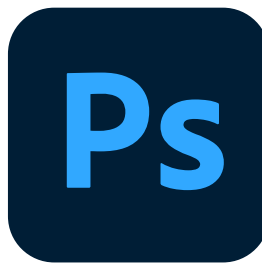
Photoshop-Vorlage City-Light-Poster (CLP)